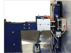
Trennvorrichtung ... Fertig!