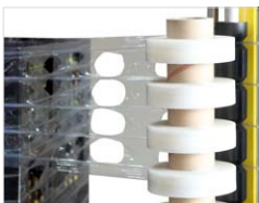
... von gelochter Folie!