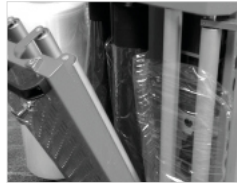
Pre-Stretch bis 300%.